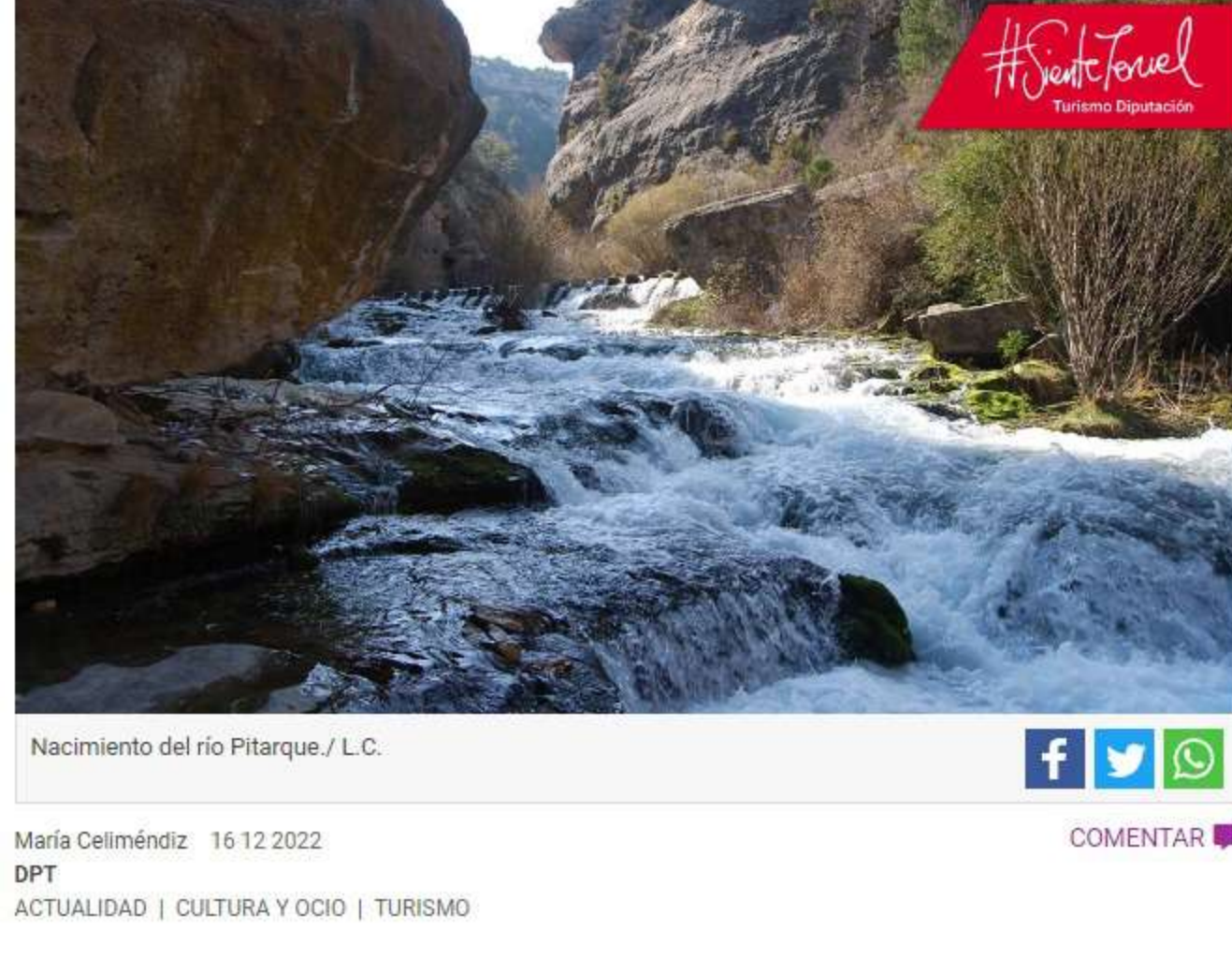
Nacimiento del río Pitarque./ L.C.

PLANES SIENTE TERUEL. El Monumento Natural del Nacimiento del río Pitarque puede visitarse a través de una ruta senderista. Desde la carretera panorámica The Silent Route se observan los Órganos de Montoro