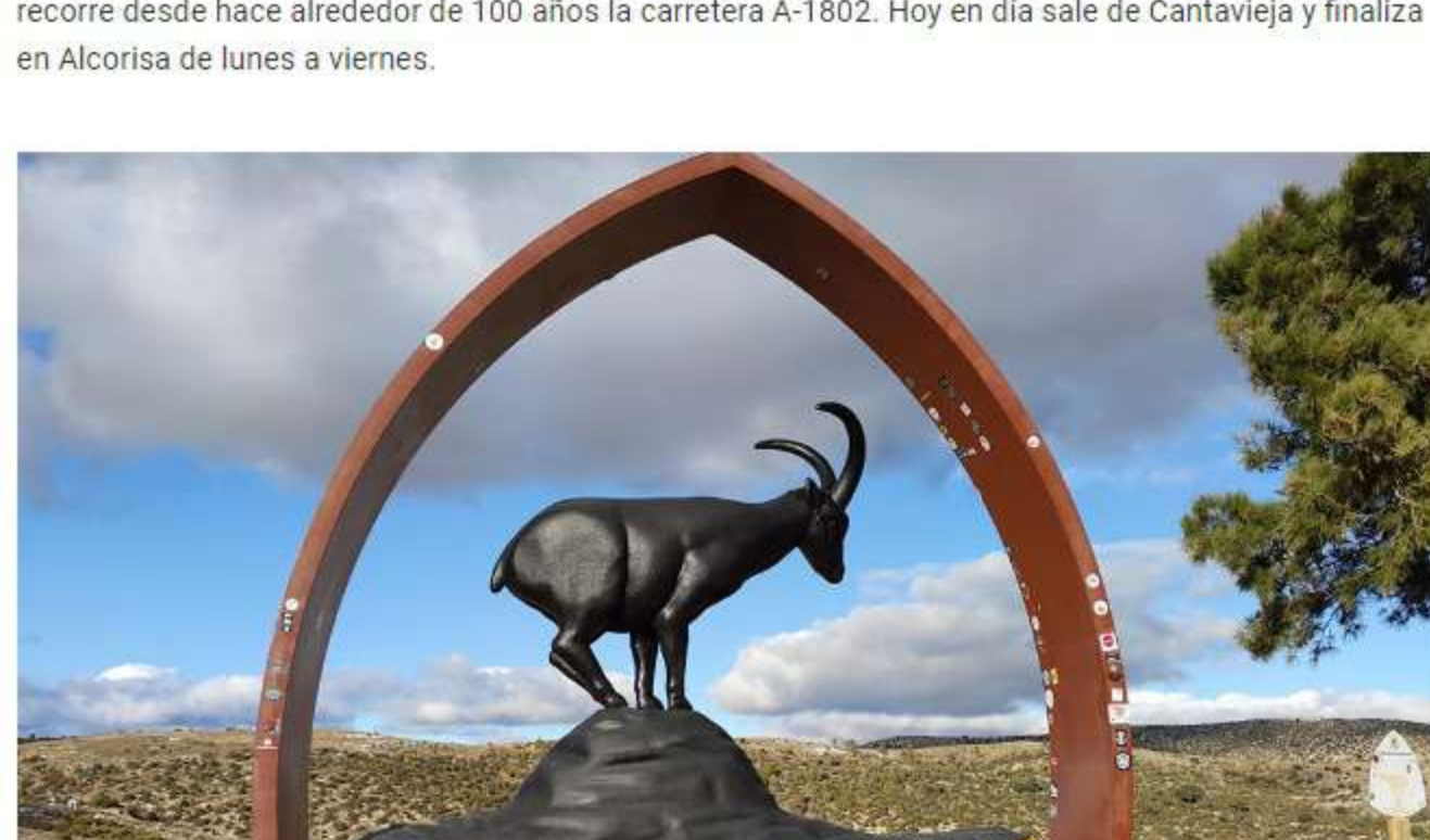
Monumento de la Silent Route.

De vuelta en The Silent Route, antes de llegar a Ejulve, debes hacer una parada obligatoria para fotografiarte con el logotipo de la carretera panorámica, una gran cabra montés . Si recorres la carretera en sentido contrario y llegas a La Cañada de Benatanduz, tendrás otro motivo de peso para bajarte del coche. En el área de descanso del kilómetro 50 se ha colocado recientemente una réplica a tamaño real del famoso autobús del Maestrazgo conocido como 'El Caimán' . Este mítico vehículo recorre desde hace alrededor de 100 años la carretera A-1802. Hoy en día sale de Cantavieja y finaliza en Alcorisa de lunes a viernes.