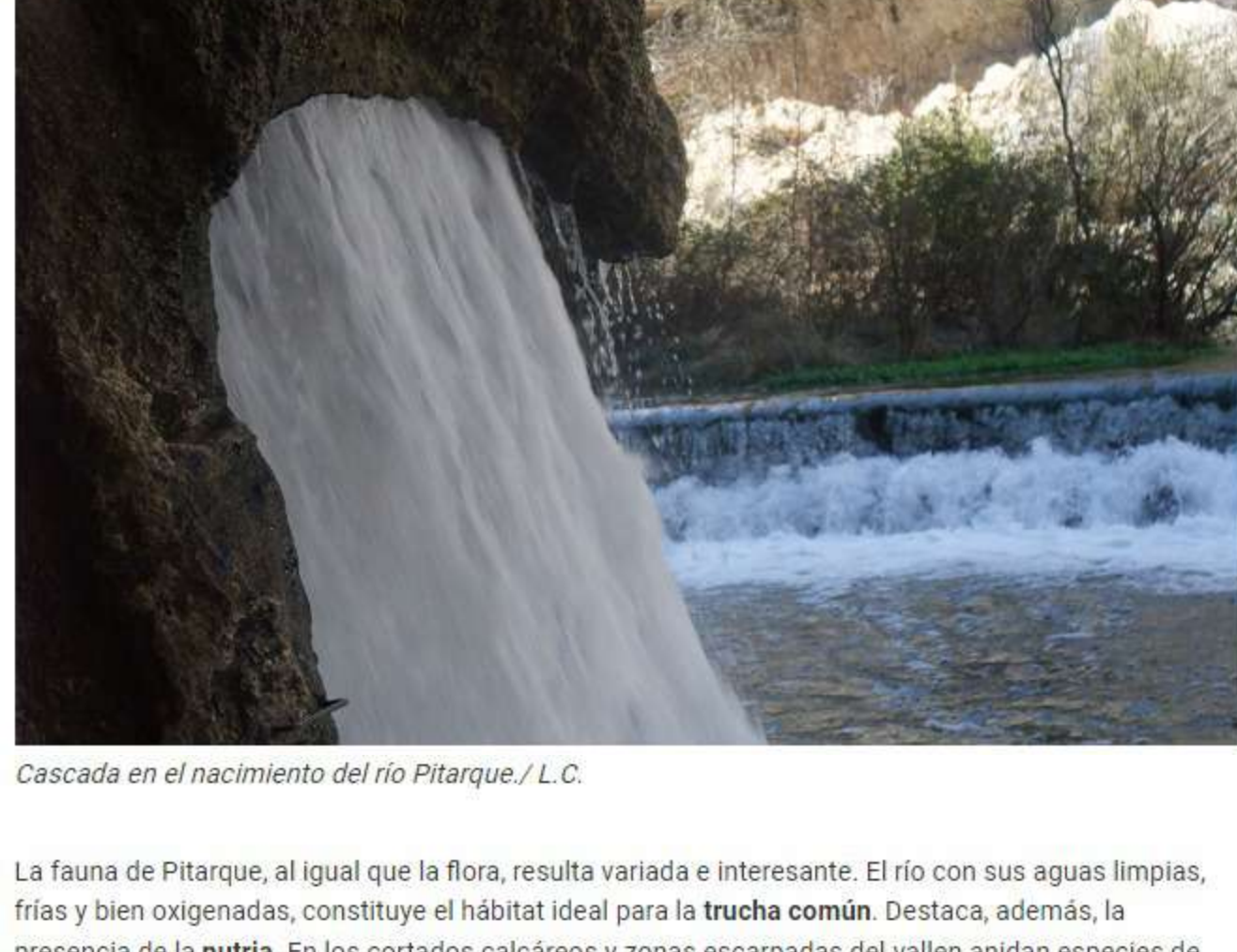
Cascada en el nacimiento del río Pitarque.

La senda continúa encañonada entre altos muros de piedra modelados por el curso del río, a lo largo del cual crecen chopos, sauces, avellanos y mostajos, hasta llegar a la antigua central hidroeléctrica. En este punto, el valle se estrecha y la vegetación se vuelve más densa, formada por serbales, arces, latoneros, hiedras y madrelejas. Más adelante, un puente te permitirá cruzar a la margen derecha para acceder a los distintos 'ojos' de la roca o surgencias kársticas que dan origen al río. Este afluente del río Guadalope es producto del afloramiento en superficie de las aguas que circulan por el acuífero subterráneo, en ocasiones con caudales de hasta 1.500 litros/segundo. Primero encontrarás la denominada Chimenea , donde el agua cae en una impresionante cascada cuando el régimen de precipitaciones lo permite. Más adelante hallarás el Ojal de los Planos , y en la margen contraria el Ojal de Malburgo , considerada la surgencia principal.