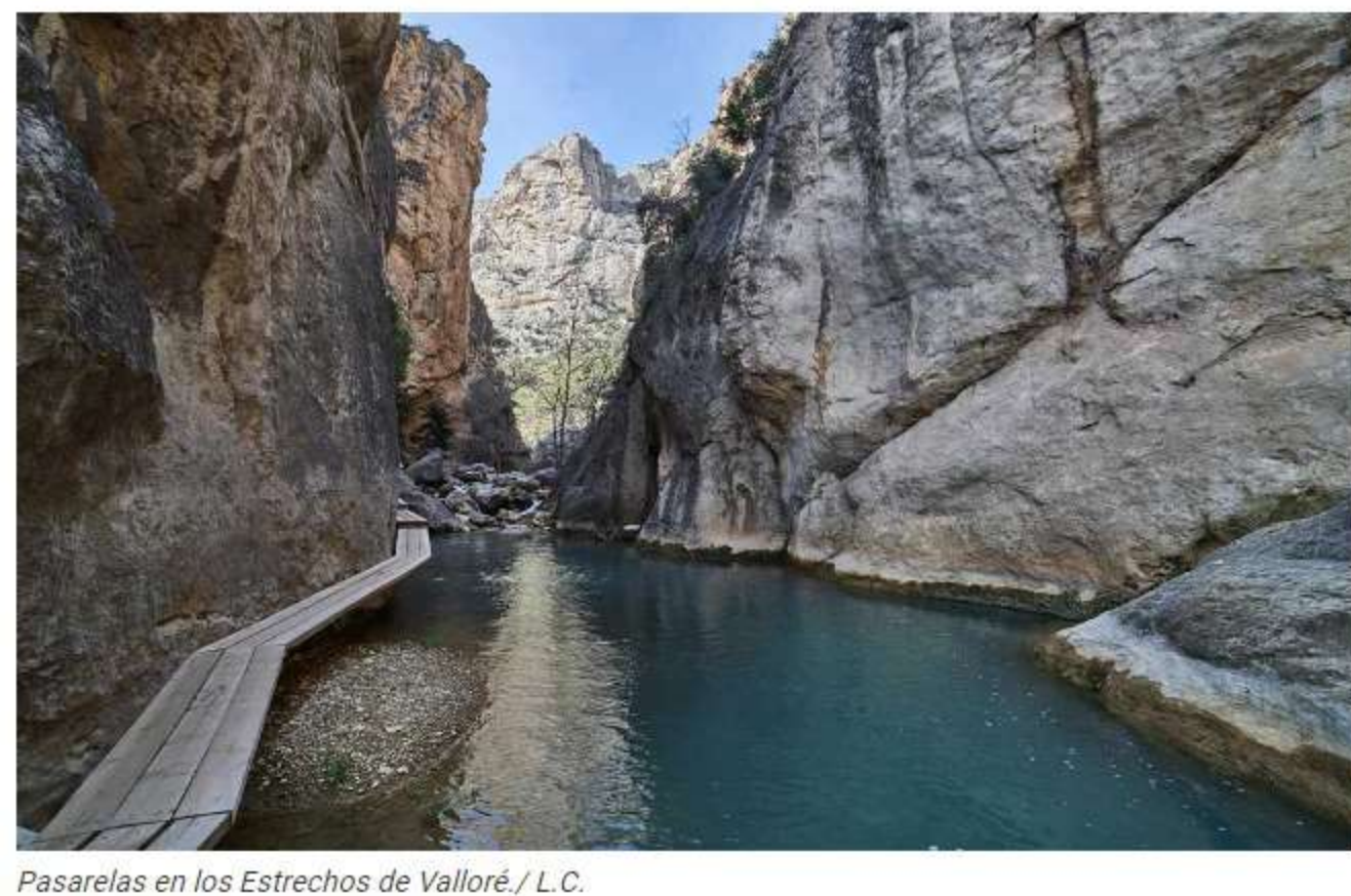
Pasarelas en los Estrechos de Valloré.

Si continúas por The Silent Route, verás a mano izquierda un desvío por una pista estrecha que conduce a Montoro de Mezquita , pedanía de Villarluengo. Recórrela para descubrir los Estrechos de Valloré . Aparca el coche en el parquin público y atraviesa las calles hasta llegar a un paraje conocido como las Eras. Allí comienza un sendero entre huertos que lleva a unas pasarelas de madera. Gracias a esta estructura de 200 metros, podrás bordear los estrechos del río Guadalope. El recorrido, apto para toda la familia, finaliza en unos 20 minutos. Para quienes quieran admirar el valle de Valloré, un nuevo sendero circular les guiará hasta el mirador . El ascenso, y posterior descenso, resultará complicado para quienes no estén acostumbrados a realizar ejercicio físico, ya que la verticalidad es considerable y en algunos tramos hay que avanzar por grapas ancladas en la piedra. Asimismo, tampoco es aconsejable para aquellos que sufran de vértigo.